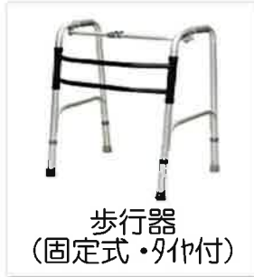
歩行器 （固定式・タイヤ付）