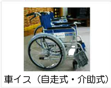
車イス（自走式・介助式）