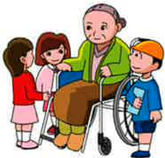
福祉施設交流体験