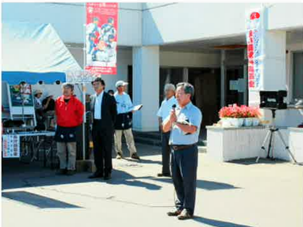
この日は、開会式から暑かったです。その中で川根町 長と吉野議長からご挨拶をいただきました

今年は、日ハムグッズ募金、 盲導犬協会のお汁粉募金、 親子休憩所やバルーンアート 体験コーナー、携帯電話(スマホ) らくらく講座や野焼きパン体験など たくさんのイベントで盛り上がりました。 来年もどうぞお楽しみに