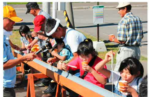
流しラーメンで少しだけ涼しくなりました