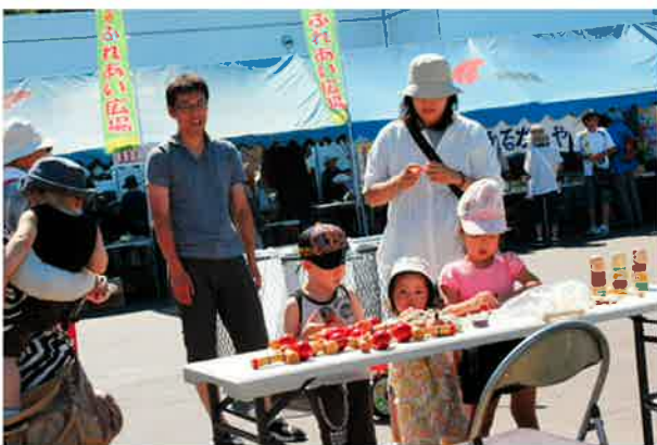
昔の遊び体験コーナーでは、けん玉や、竹とんぼ、 竹馬など昔の遊び道具がいっぱいでした