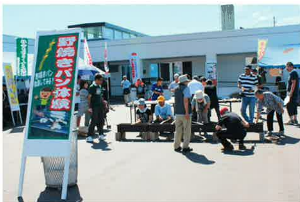
若佐小学校に教えていただき実施した野焼きパン体験