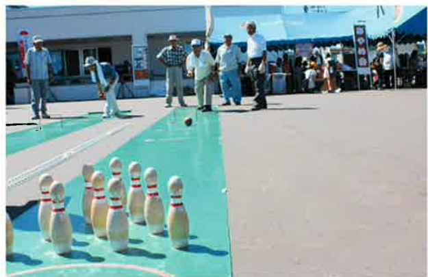
ボーリング大会にもたくさん参加していただき ましたが、なにせ暑かったです！！