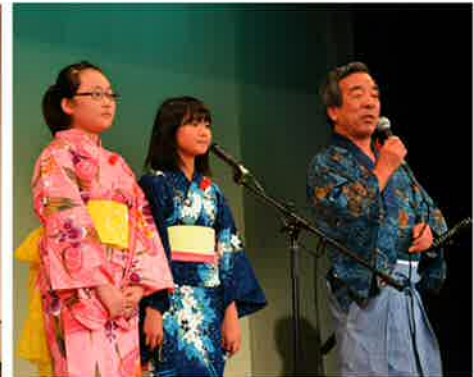
町長さんには時代劇の扮装で子どもさんと一緒に子連れ狼を歌って頂きました