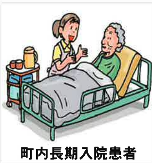
町内長期入院患者