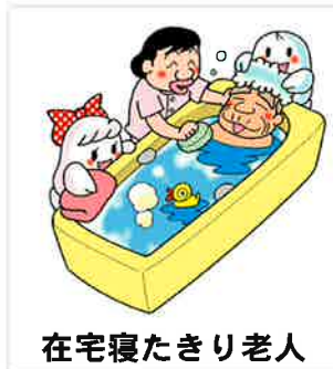
在宅寝たきり老人