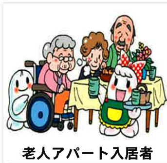
老人アパート入居者