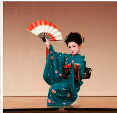
若柳臣流若寿会の子どもさんには日舞を踊ってもらいました