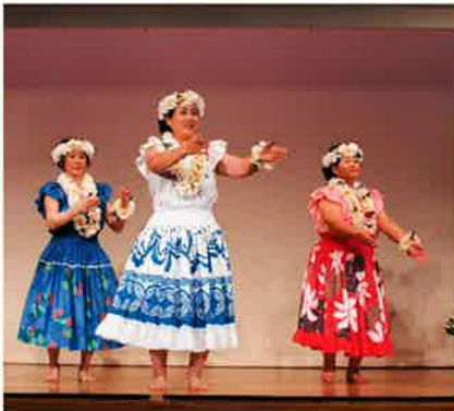
サロマフラの会には今年も素敵な衣装でフラダンスを披露して頂きました