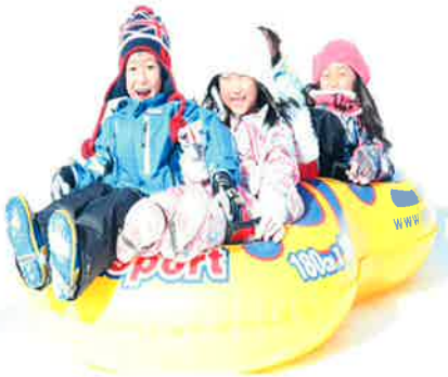
子供たちは大喜び

2月19日(日)、今年で13回目を迎えた「かまくら雪まつり」を、町民センター駐車場で開催しました。