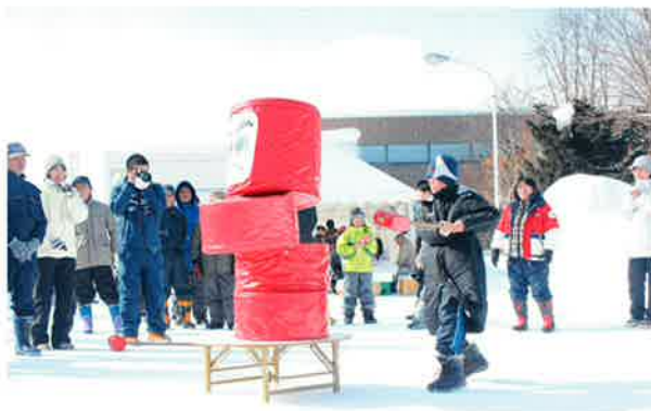
巨大だるま落としで大興奮!!

昨年と場所の変更もありましたが、当日は約300名の高齢者やお母さんや子どもたちに参加いただき大いに盛り上がりました。