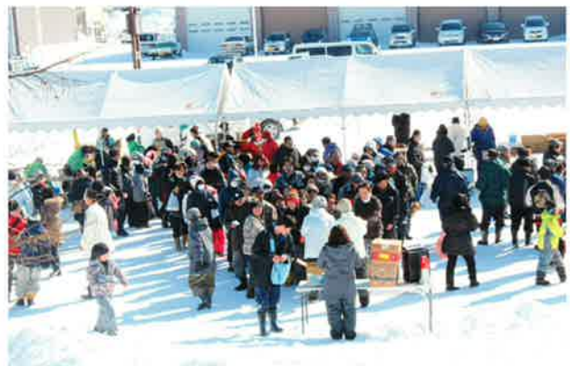
たくさんのご来場ありがとうございました