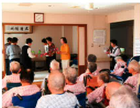
患者さんにダンスと歌を披露しています

六月二十六日には、若佐から九名の『昔の』お嬢さん達が訪れ、ダンスやカラオケで会場を沸かせましたが、自己紹介では、自らの闘病体験を告白し、きつと元気になれますよと、患者さんを励ましておりました。