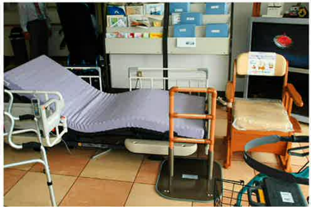
北海道社会福祉協議会との共催で、福祉用具・住宅改修相談会を実施しました