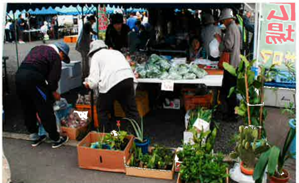
あやめ会では、野菜や庭木が販売され好評でした