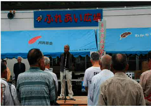
開会式は、町長、議会議長、シンデレラ夢実行委員会会長に、ご挨拶いただきました

今年は、下の写真以外にもモチつきや、風船割りや正確投げのゲーム大会、汁粉募金ドンの無料配布、老連女性部や身障分会、かるがもネットワークの出店など、たくさんのイベントで盛り上がりました。来年もどうぞお楽しみに