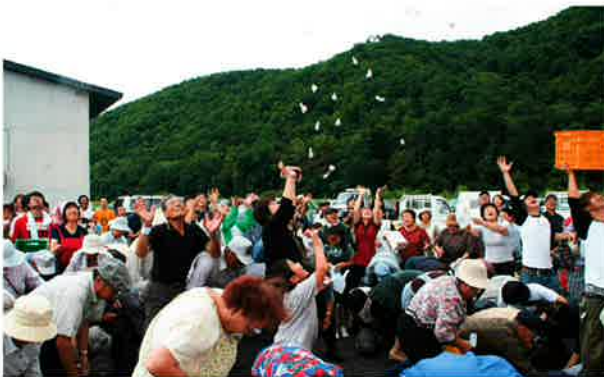
モチまきも行われ、来場者に喜んでいただきました