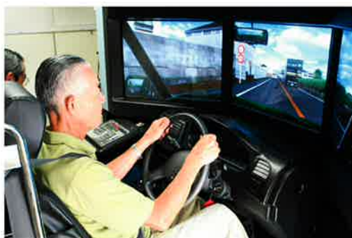
初めてのコンピュータ疑似体験でしたが皆さん上手に運転してました。

九月二日、北海道警察の交通安全教育車による、「安全運転講習会」が福祉センター駐車場で開催され、シルバードライバーズクラブ会員が参加しました。この道警の教育車両は高齢運転者の運転特性を自分で疑似体験しながら理解する講習で、二十名の体験車は、自分の運転の注意点などを、担当者に教えてもらいながら、コンピュータによる疑似運転を体験しました。