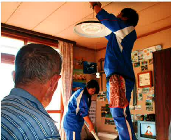
高校生が一生懸命ボランティアする姿を ご利用者も嬉しそうに眺めています

11 月 11 日佐呂間高校で、1 年生が参加したボランティア体験学習が実施されました。