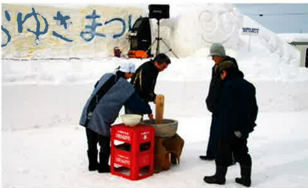
開会式の後に餅つきを行いました。最初は町長さんについてもらいました