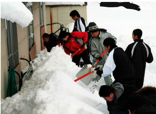
老人アパートの除雪ボランティアの様子です 野球部とバドミントン部の13名が取り組みました

先月号の社協だよりでも紹介しましたが、たすけあいチームや自治会福祉部に対して除雪機と排雪用トラックの貸し出しを行っておりますので、地域の除雪ボランティアにご活用下さい。