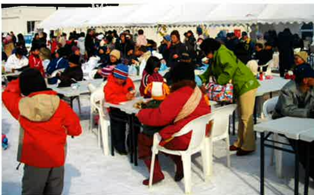
たくさんの方に来場いただきました。みなさん老連や身障分会のテントで、うどんやお汁粉や焼き鳥は、寒い会場ではとてもおいしかったです