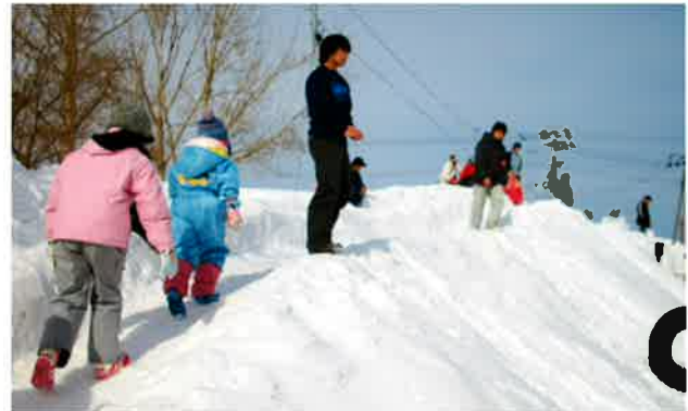
タイヤ滑り台にはいっぱい子どもが集まりました 高校生ボランティアが順番整理をしています