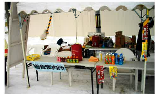
かるがもネットワークのテントで運営した「総合案内所」です。会場イベントの紹介や、オムツ交換所の案内など、会場をガイドしてもらいました