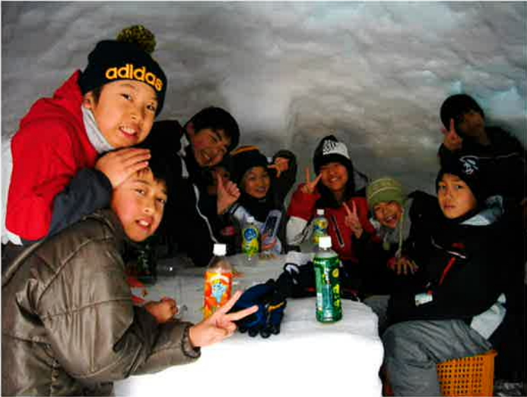
友達同士でかまくらの中で 楽しそうですね

今年の雪まつりは、2月15日（日）の休日開催となり、350名を超える来場を頂く大きなイベントとなりました。