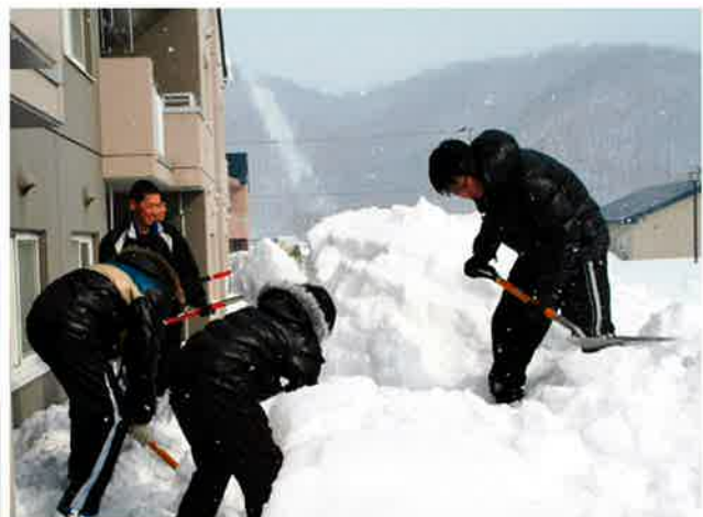
2月の台風並みの低気圧で団地のベランダに吹き込んだ雪をていねいに除雪していきます