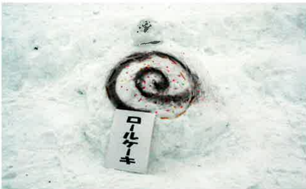
雪像コンテストで優勝した小学1年生の雪像から「ロールケーキ」です。発想が面白いですね