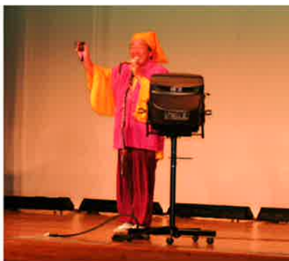
水戸黄門に扮装した町長さんがカラオケの最後の印籠を出すと会場は大いに沸きました

今回のチケット売上げや会場での募金活動収益は、地域の福祉活動に役立てるため、共同募金会佐呂間分会に、132,752円を寄付致しました。ご協力いただきました皆様、ご来場いただいた皆様には、深く感謝申し上げます。