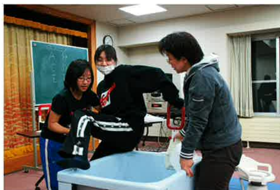
入浴介助体験です、講座には高校生も参加しています