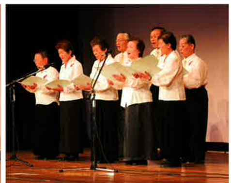
佐呂間吟詠会による台吟「山居」の披露です