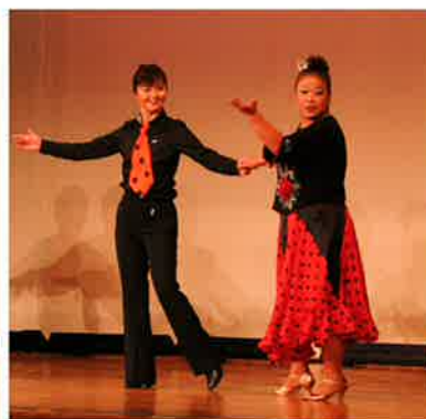
佐呂間社交ダンス同好会には6名ペアで踊って頂きました