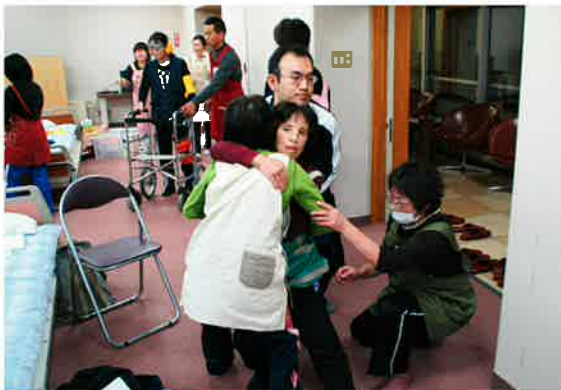
床に倒れた際の車椅子移乗の体験です

10月2日開講した「ホームヘルパー2級養成講座」ですが、24名の受講生に参加頂き、10月は通信教育、11月は町内専門職を講師に招きスクーリングを実施、12月は町内福祉施設等で現場実習を行っております。1月15日の修了式には、ヘルパー2級の修了証が受講生に手渡される予定です。