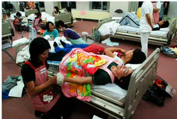
ベッドでの清拭を体験中です