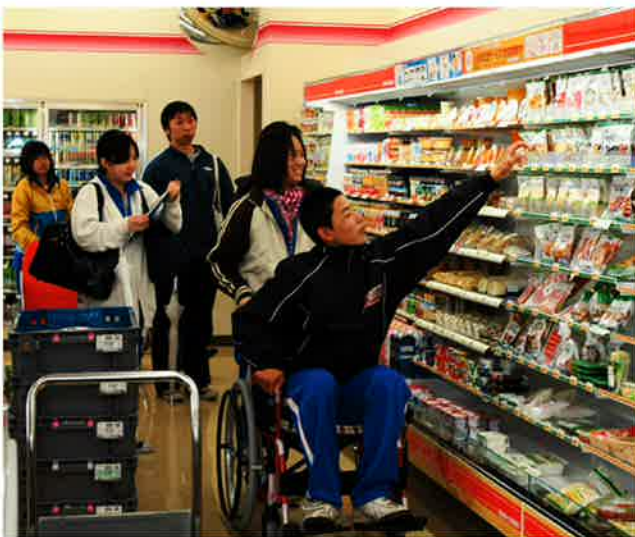
車イスに乗ったまま商品が取れるか 確認中です