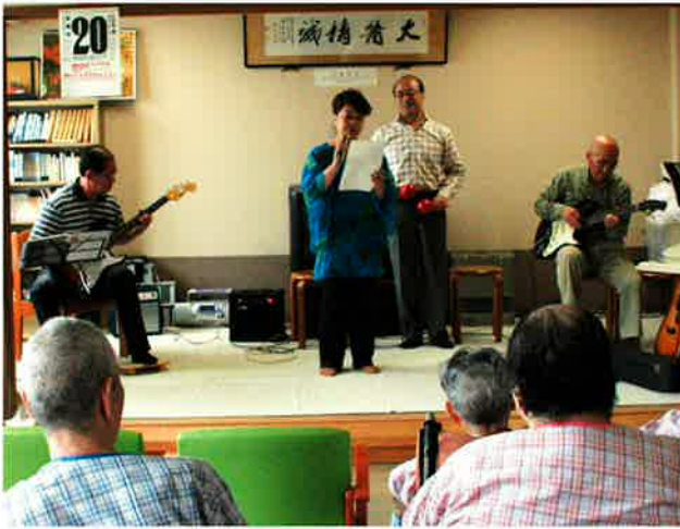
オヤジバンドですが女性も参加しています

バンドの演奏は、昭和歌謡やハワイアンなど、患者さんの世代に合わせて行われ、皆さん楽しげに聴いておりました。