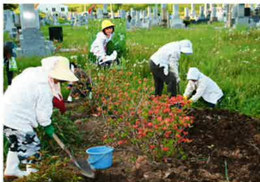
親子で一緒に花壇作りのボランティア