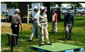
美幌のパークゴルフ大会

八月にはゲートボールのメツカ芽室町で開催する全道ゲートボール大会に出場を予定しており、その活躍が期待されます。