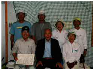
見事 五位入賞です