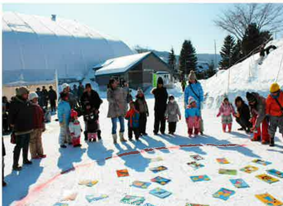
巨大カルタは走って!飛んで!大笑い!!

当日は350名の高齢者やお母さんや子どもたちに参加いただき大いに盛り上がりました。