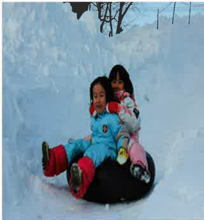
毎年好評のすべり台。スリルがたまりません

2月20日(日)今年で12回目を迎えた「かまくら雪まつり」を、ホワイトドーム駐車場と福祉センターで行いました。