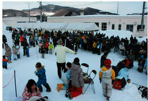
たくさんのご来場ありがとうございました