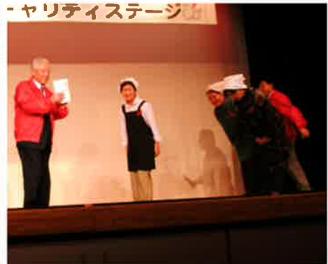
会場では「トゥモローライフさろま」がぶ汁・お汁粉を販売し売上げ全額を共同募金に寄付頂きました