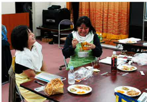
食事介助の体験中ですがとても楽しそうです