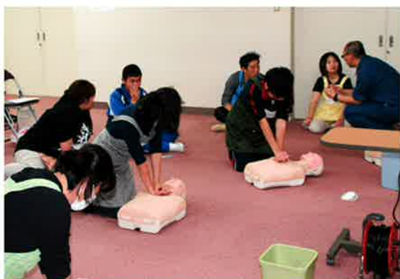
消防署佐呂間支所に協力いただき救命講習を実施しました