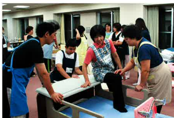
ベッドからの移動介助を受講中です