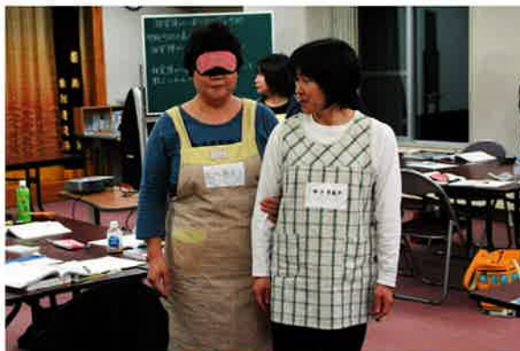
アイマスクを使った視覚障害体験です