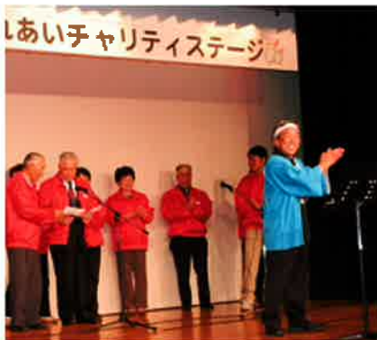
町長さんにはドリフターズの音頭を披露して頂き共募役員と老連役員がいつしょに踊りました