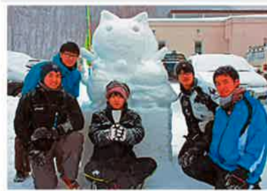
今年の高校生の雪像は上手だと評判でした