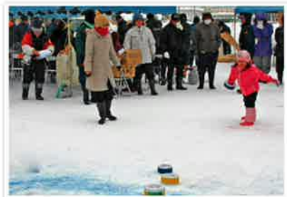
このカーリングから将来の五輪選手が?