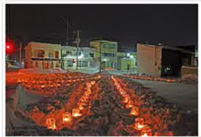
キャンドルナイトも風雪の中参加いただきました